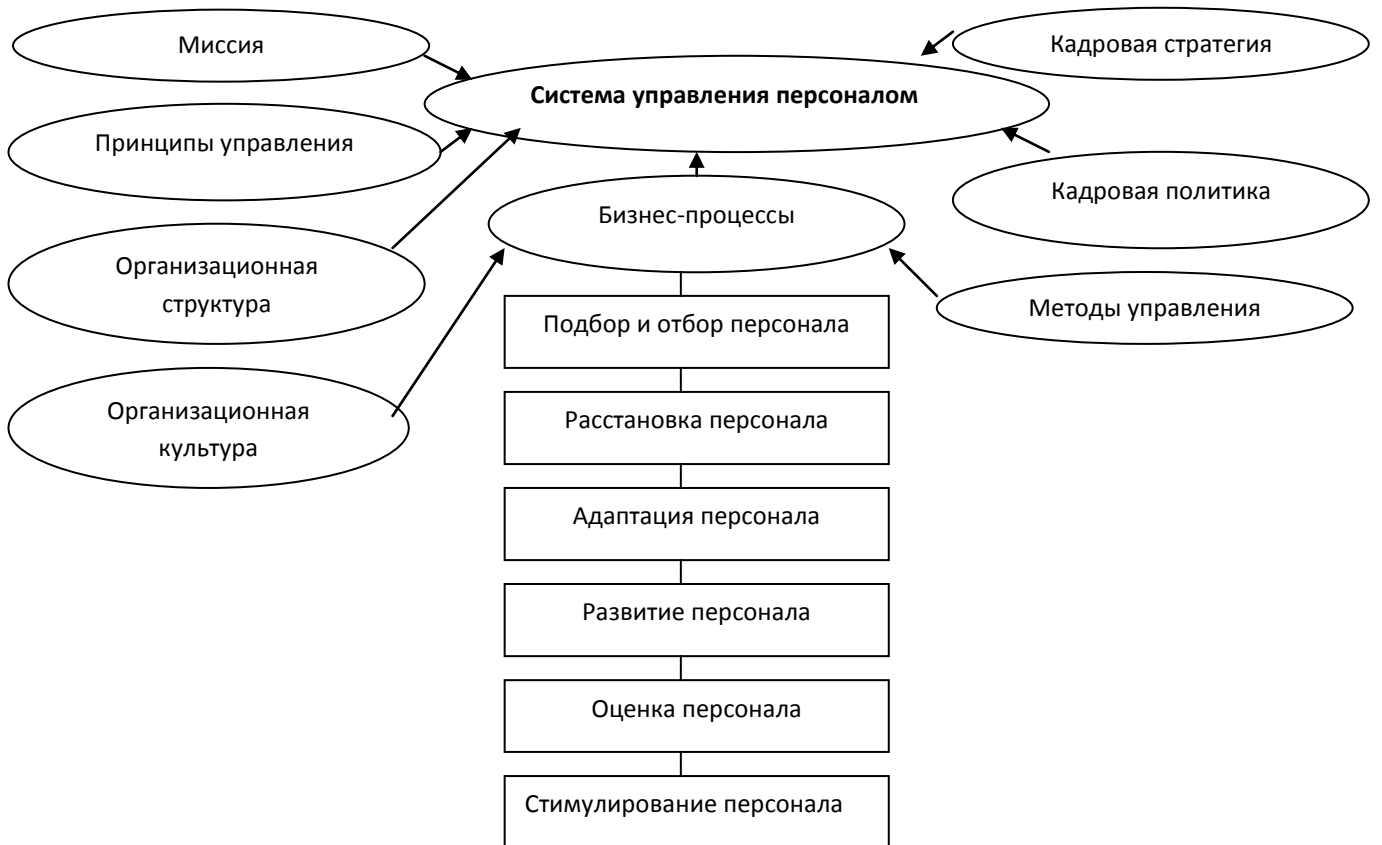
Рисунок 3. - Система управления персоналом